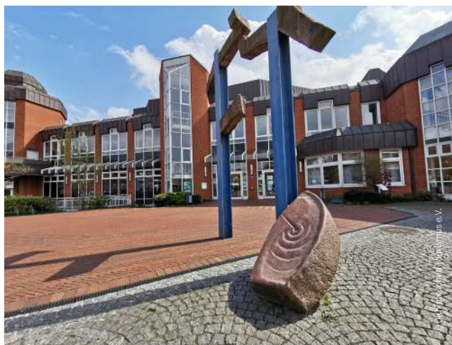
Im Erdgeschoss des Kultur- und Tagungszentrums Elbeforum befindet sich die Stadtgalerie Brunsbüttel

Das Stadttheater Heide hat sich als zentrales Veranstaltungszentrum von der kleinen, feinen Kulturveranstaltung bis zur großen Party einen Namen gemacht. In unmittelbarer Nähe zum Heider Marktplatz erlebst du hier Konzerte, Kleinkunst und Theater, Kabarett, Workshops und Seminare mit nostalgischem Flair. Das traditionsreiche Haus mit moderner Ausstattung empfängt unter anderem regelmäßig das Schleswig-Holsteinische Landestheater und Sinfonieorchester.