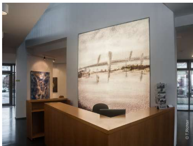
Das Kultur- und Bürgerhaus Marne bietet neben wechselnden Ausstellungen auch ein vielseitiges Veranstaltungsprogramm