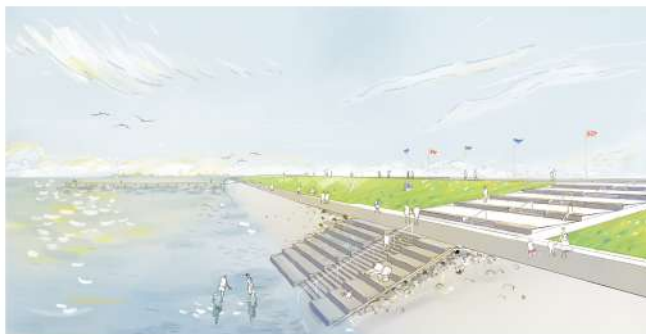
Visualisierung © Bruun & Möllers