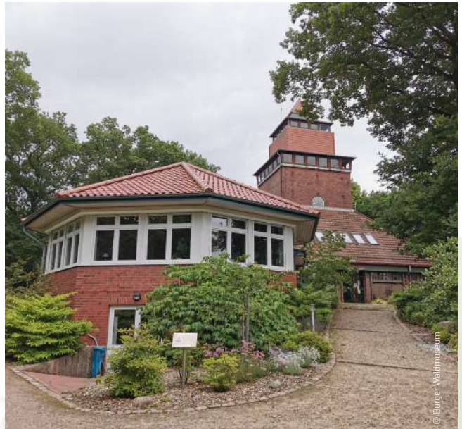
Das Burger Waldmuseum

Eine Besonderheit ist das kostenlose Deichfreilichtmuseum in Büsum. Vor der Kulisse des imposanten Büsumer Landeschutzdeichs kann man sich hier ein Bild von der Entwicklung unserer Deiche machen: von den Anfängen mit niedrigen Sommerdeichen bis hin zu den modernen Bollwerken, die heute unsere Küste säumen.