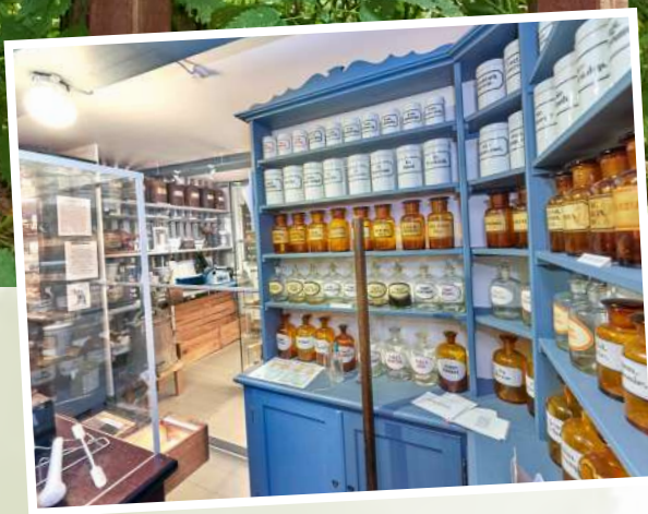
Ein Einblick in die alte Apotheke im Museum Ditmarsium.