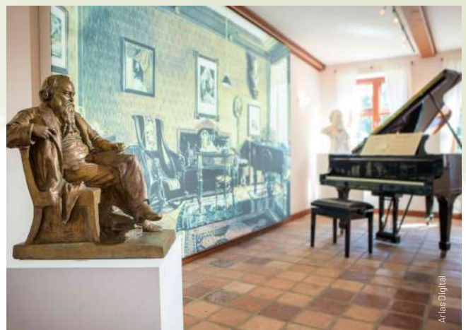
Das Musikzimmer im Brahms-Haus in Heide

Friedrich Hebbel, einer der berühmtesten deutschsprachigen Literaten des 19. Jahrhunderts, wurde am 18. März 1813 im Marktflecken Wesselburen geboren. In der alten Kirchspielsvogtei, in der er in jungen Jahren als Hauptschreiber und Protokollführer arbeitete, erzählen heute zehn historische Räume von seinem bewegten Lebensweg. An drei Standorten in der Stadt kannst du zudem an der HÖRBAR, Stelen mit integrierten Hörtrichtern, Gedichten von Friedrich Hebbel lauschen - kostenlos und rund um die Uhr.