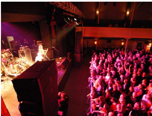
Das Stadttheater in Heide lockt mit zahlreichen Veranstaltungen